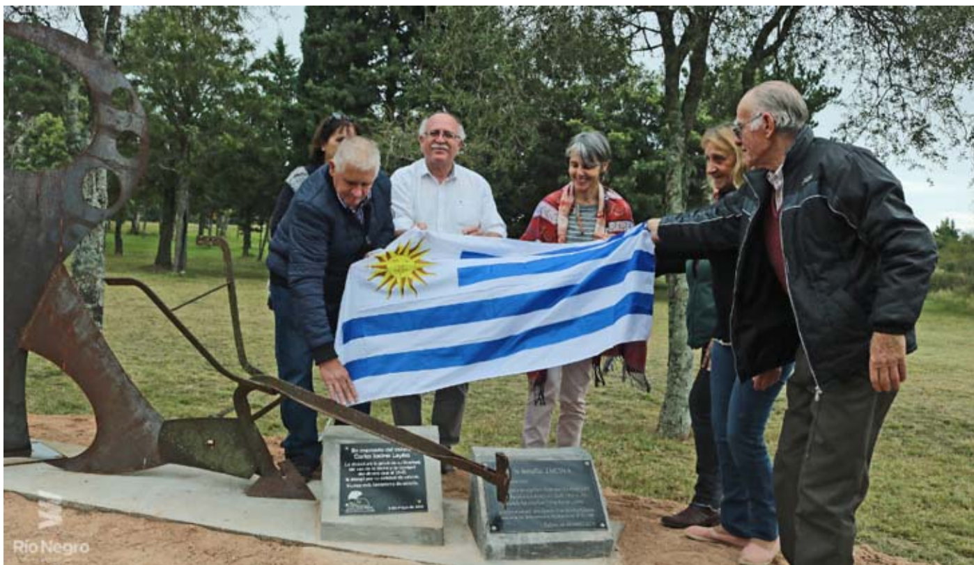
Memorial a las víctimas del terrorismo de Estado en San Javier.

Dicha actividad se enmarca en lo dispuesto por el artículo 23 de la Ley 19.641 de Sitios de Memoria Histórica del Pasado Reciente.